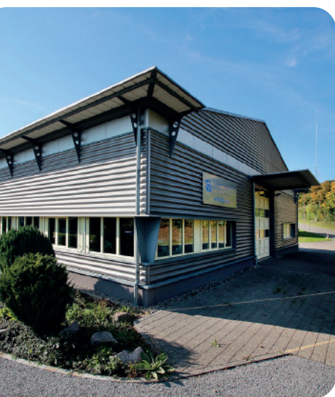
Standort Hagenbuch Lager & Logistik

Die Procamed AG mit Firmensitz in Aadorf (TG) ist seit 30 Jahren Ihr kompetenter, innovativer und zuverlässiger Partner für medizinaltechnische Lösungen von höchster Qualität in den Bereichen Notfall- und Rettungsmedizin.