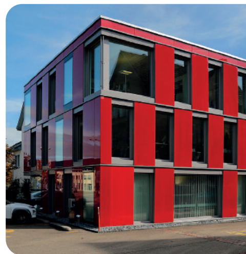
Standort Aadorf Administration, Medizintechnik & Kundensupport

Als Generalimporteur von ZOLL Produkten haben wir in der Schweiz bisher über 30'000 ZOLL AED Defibrillatoren installiert und es werden täglich mehr.