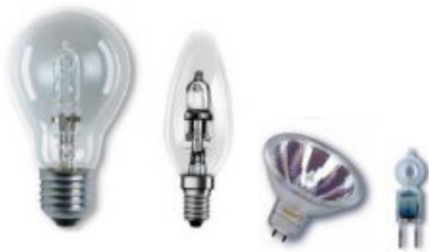
Birnen- und kerzenförmige Hochvolt-Halogenlampen und Niedervolt-Halogen-Spot und -Lampe

ECO-Halogenlampen verbrauchen rund 30% weniger Strom als konventionelle Glühlampen. Eine 42-Watt-Halogenlampe gibt gleich viel Licht wie eine 60-Watt-Glühlampe (im Handel nicht mehr erhältlich). Alte, herkömmliche Halogenlampen können durch ECO-Modelle ersetzt werden. Damit sparen Sie 30% Strom. Zudem zeichnen sich die Eco-Halogenlampen durch eine sehr gute Farbwiedergabe (Ra 100) aus.