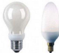
Sparlampen in Birnen- oder Kerzenform eignen sich für den Ersatz von 15 bis 100 Watt Glühlampen.

Energiesparlampen erzeugen gleich viel Licht wie Glühlampen und benötigen dazu nur ein Fünftel der Energie. Moderne Energiesparlampen sind flimmerfrei und können dank des gleichen Schraubgewindes bestehende Glühlampen einfach ersetzen.