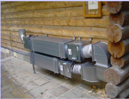
Bild: Wärmerückgewinnung einer Sauna, noch nicht eingekleidet. Rückgewinnungsgrad 80%

Die Abwärme der Sauna wird, da die Luft mit ätherischen Ölen behaftet ist, oft warm ins Freie geleitet. Anstatt die warme Abluft aus der Sauna ungenutzt auszublasen, könnte diese jedoch über einen (Kunststoff-)Wärmetauscher die Frischluft vorwärmen und so den Energieverbrauch spürbar senken.